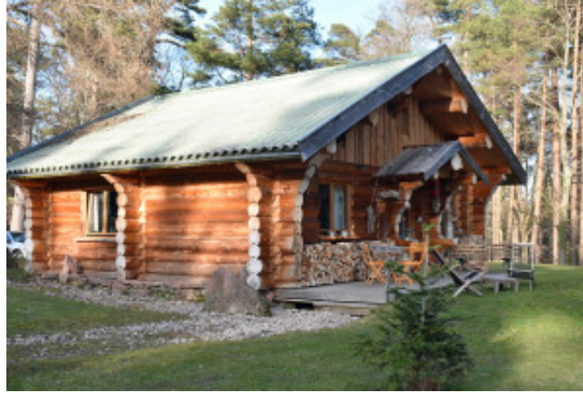
Chalet Eloi?se Les Hauts de Ribeauvillé

mousse-lichen qui agit comme une climatisation naturelle. Celle-ci apporte de la fraîcheur en été et garde la chaleur en hiver. Et surtout le toit change de couleur selon les saisons. Grâce à ces chalets, on vit au contact de la nature. La nuit ou au petit matin, on peut apercevoir cerfs et brocards. Ces chalets ont été décorés dans une ambiance montagnarde chaleureuse avec le poêle au milieu de la pièce à vivre. Ils offrent tout le confort.